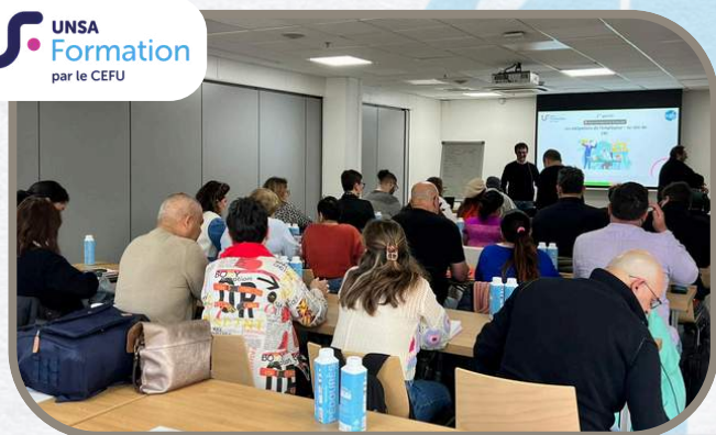
Formation CSSCT pour nos équipes du groupe Clariane (Korian-Inicéa) par nos formateurs du CEFU. (2 jours)